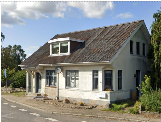
Fåborgvej 68

Mart.nr: V. Skerninge By, V. Skerninge ( m 2 )