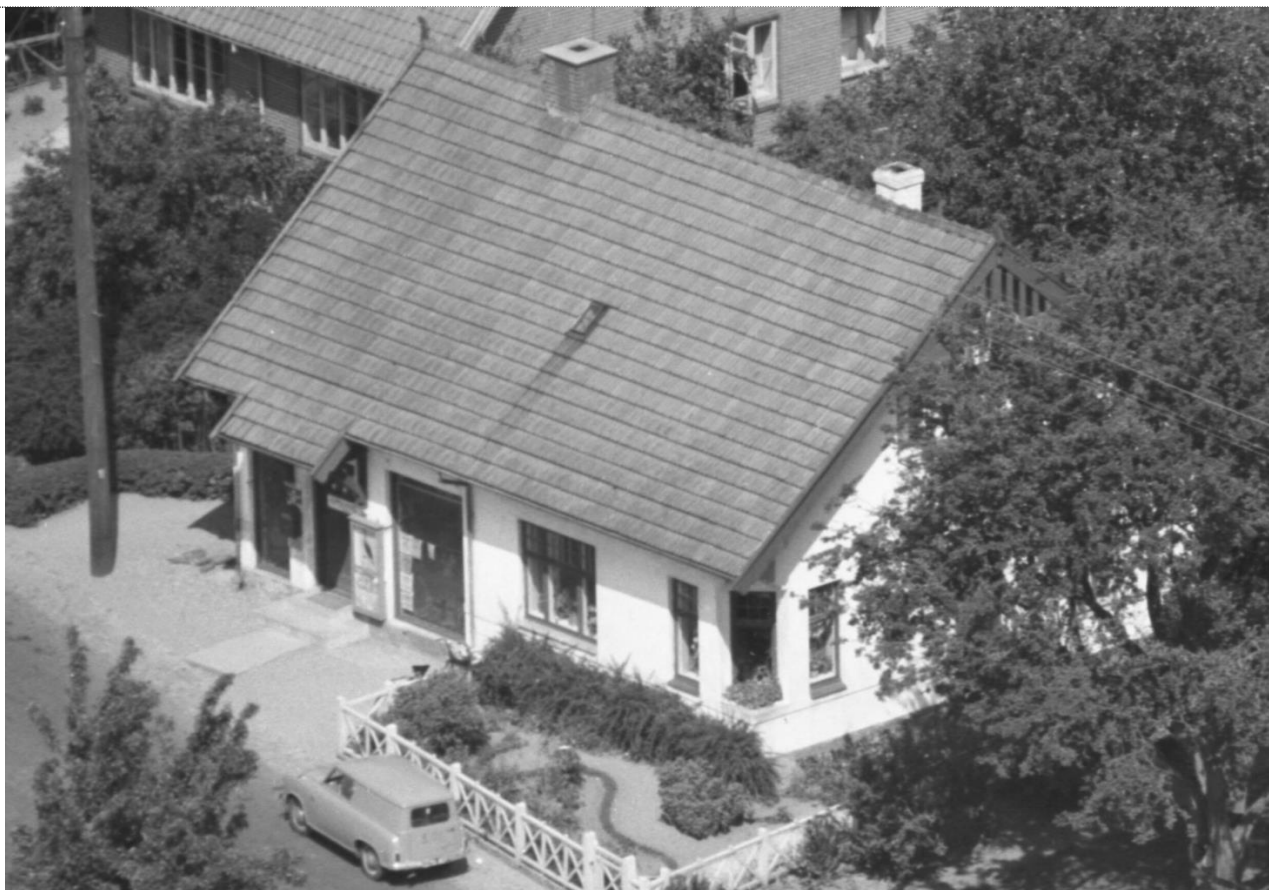
Fåborgvej 68 i mange boghandel – 1959 - Kilde: Danmark set fra luften .