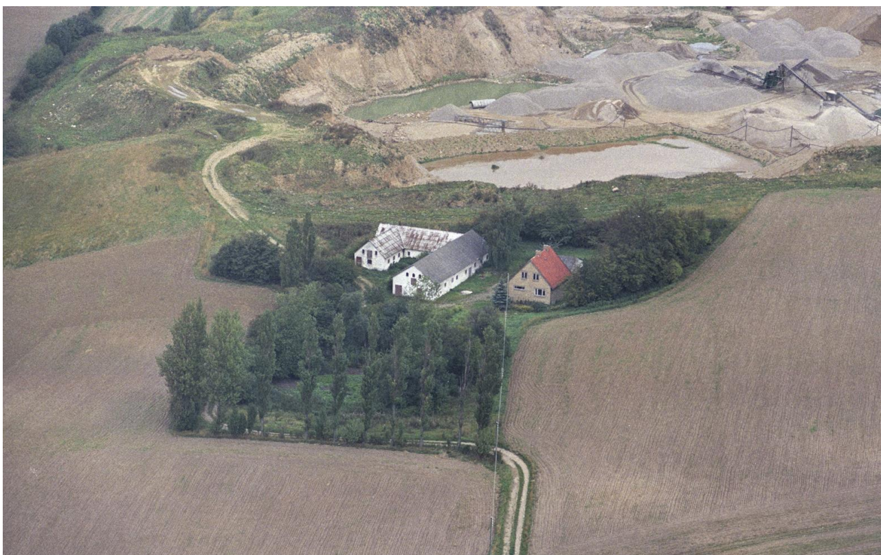
Billede 4 - Ravnegårdsvej 20 - Ballengård – Korsbjerggård, Hulen - 1989