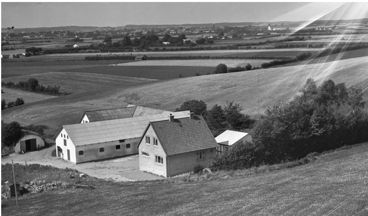
Billede 3 Ravnegårdsvej 20 - Ballengård – Korsbjerggård, Hulen - 1953